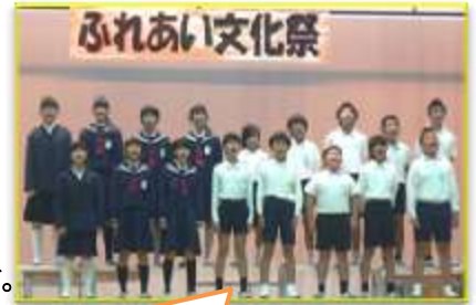
6年生の力強い歌声に感動！

22日のふれあい活動・小中合同文化祭には、多数ご参加またご協力くださりありがとうございました。新しい試みでしたので不安な面が多々あったのですが、終日、子どもたち一人一人の楽しそうな表情や頑張りが見られ、たいへんうれしく思いました。特に、ステージに立つという経験は、自分への自信にもつながります。先生方には、全員が達成感を味わえるような指導や配慮をお願いしていました。当日は見事な発表でしたね。塩江小学校の子どもたちの可能性の大きさを感じました。保護者の皆様の温かなご支援に感謝します。